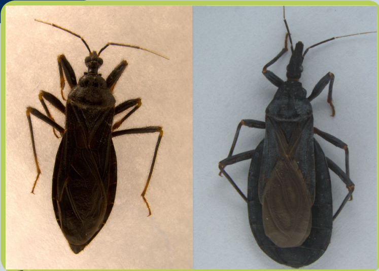
Arriba: Figura 3. Comparación visual: cazador enmascarado a la izquierda; Vinchuca a la derecha

A veces la gente se preocupa por que puedan haber contraído la enfermedad de Chagas después de haber sido mordidas por el cazador enmascarado. La enfermedad de Chagas, también llamada americana tripanosomiasis, es un parásito ( Trypanosoma cruzi ), este parásito se transmite a través las heces fecales de un grupo de bichos conocidos como “vinchucas”. Los cazadores enmascarados no son verdaderos vinchucas, ni beben sangre. Los cazadores enmascarados no albergan ni propagan la enfermedad de Chagas.