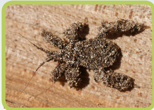
Figura 2. El cazador enmascarado en su forma ninfa.