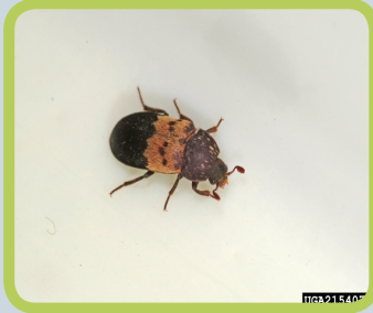
Figure 6. Escarabajo de despensa adulto.

En Utah, el escarabajo de almacen es una plaga comun de la comida guardada. Cuando busque por estas pestes, tambien tenga en cuenta otras plagas conocidas como "plagas de despensa"